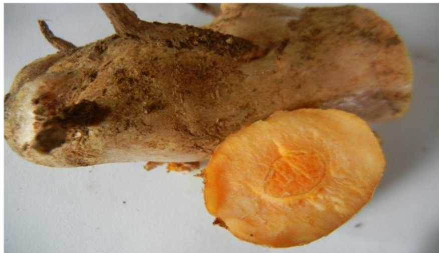
Gambar 1. Rimpang Temulawak (Itanursari, 2009)