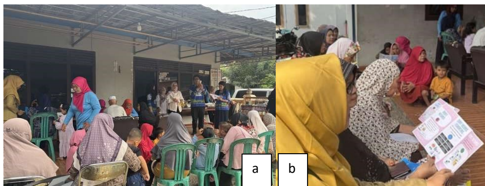
Gambar 1: Kegiatan edukasi (a) dan Peserta membaca leaflet (b).

dengan metode presentasi materi, diskusi, dan tanya jawab seputar materi yang telah disampaikan (Gambar 1). Kegiatan sosialisasi dan edukasi berjalan dengan baik dan lancar. Saat dilakukan sesi tanya jawab, banyak masyarakat masih kebingungan memahami penggolongan obat dan cara menyimpan obat dengan baik dan benar. Kegiatan ini ditutup dengan melakukan pengisian kuesioner post-evaluasi untuk melihat apakah masyarakat mengerti dan memahami penjelasan yang telah dilakukan oleh tim pengabdian.