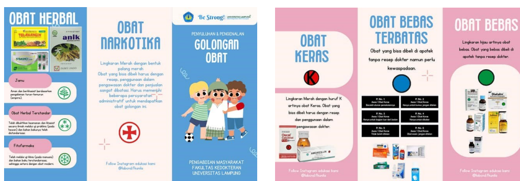
Gambar 2. Media leaflet penggolongan obat.

Pelaksanaan edukasi dilakukan melalui metode presentasi, pembagian leaflet, diskusi, dan tanya jawab. Materi yang diberikan meliputi pengenalan golongan obat yang tersedia di Indonesia beserta logo dan aturan penggunaannya, serta edukasi mengenai penyimpanan obat yang tepat. Penggunaan leaflet sebagai media edukasi membantu peserta memahami materi dengan lebih mudah karena informasi disajikan secara ringkas dan disertai gambar, sebagaimana ditunjukkan pada Gambar 2.